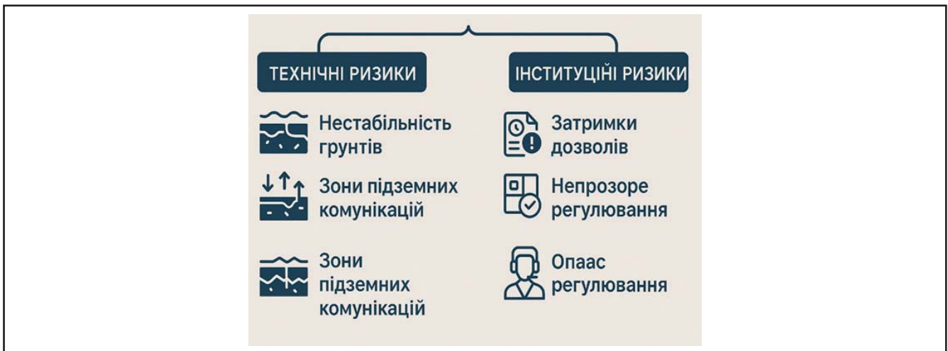
Рисунок 3. Класифікація технічних і інституційних ризиків, що підлягають нейтралізації під час інженерної підготовки

Щоб забезпечити комплексне розуміння того, які саме ризики піддаються впливу на етапі інженерної підготовки, доцільно звернутися до ри-