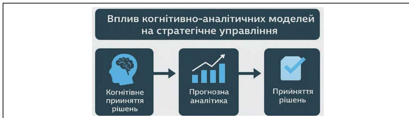
Рисунок 2. Трансформація стратегічного управління під впливом когнітивно-аналітичних моделей