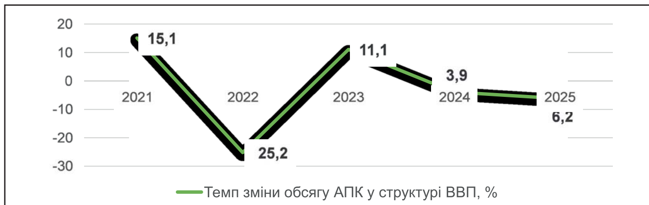
Рисунки 2. Зміна вкладу АПК у створення ВВП (% до попереднього року) у 2021–2025 рр.