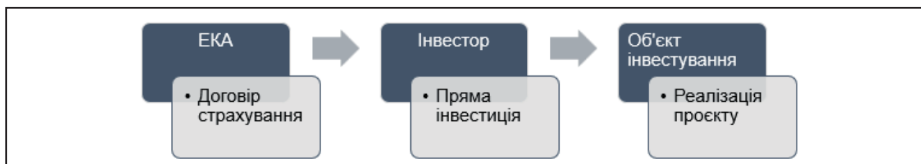
Рисунок 2. Процес страхування ризиків у ЕКА