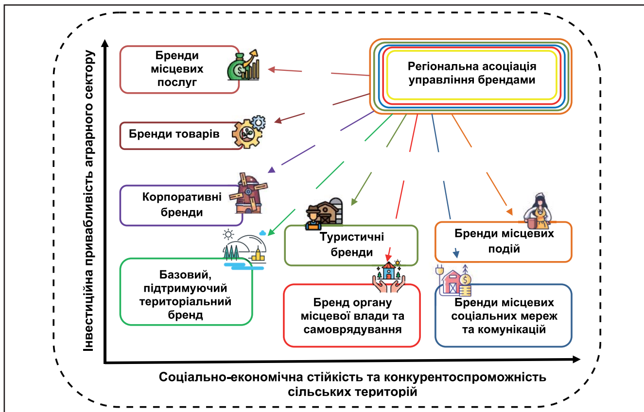
Рисунк 2. Модель комплексного застосування брендингу в аграрній сфері