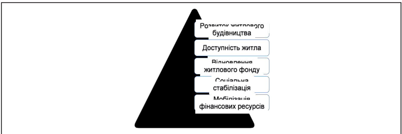
Рисунок 1. Цілі інструментів підтримки житлового будівництва

Розглядаючи вищезазначені цілі слід підкреслити, що попри ряд негативних соціальних проблем породжених пошкодженням та руйнуванням житлового фонду, створили в Україні умови для його модернізації, що особливо актуально в контексті досягнення сталого розвитку. В цьому ключі ВРІЕ (Європейський інститут ефективності будівель) пропонує критерії для сталого відновлення будівель в Україні, дотримання яких, дозволяє досягти подвійної мети – модернізувати та відновити житловий фонд та сприяти досягненню Цілей сталого розвитку (табл. 2). Замість відновлення систем за застарілими підходами, до-