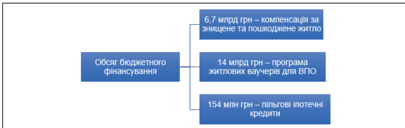
Рисунок 3. Бюджетне фінансування житлових програм в Україні у 2026 році